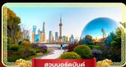
สวนนอร์คบันด์