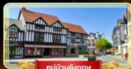
หมู่บ้านอังกฤษ