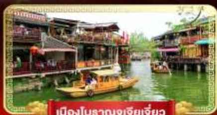
เมืองโบราณซูเจียเจี้ยว