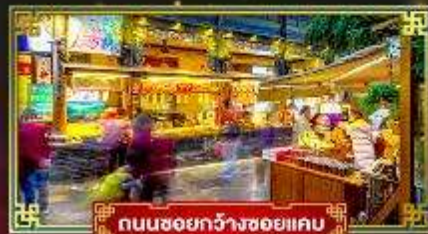
ถนนชอยกว้างชอยแคบ