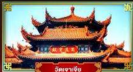
วัดเจเจีย