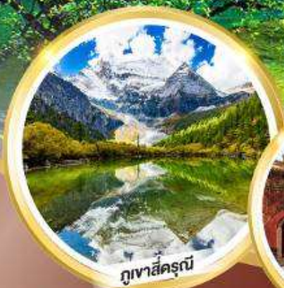
ภูเขาสีดรุณี