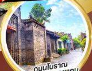
ถนนโบราณ ซอยกว้างชวยแคบ