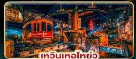
เทวินเทอโฮย๋อ