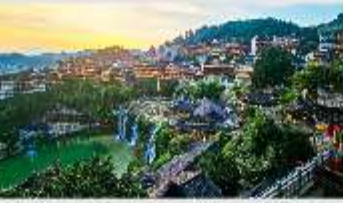
เมืองโบราณฟูหรงเจิน