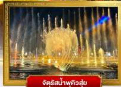
จัตุรัสน้ำพุควิสุย