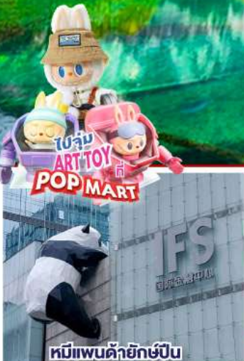
หมีแพนด้ายักษ์ปิ่น ตักถนนซุนซีลู่