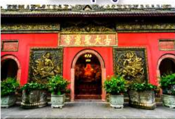
วัดต้าฉี้อ