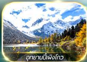
อุทยานบิ๋นเฟิงโกว