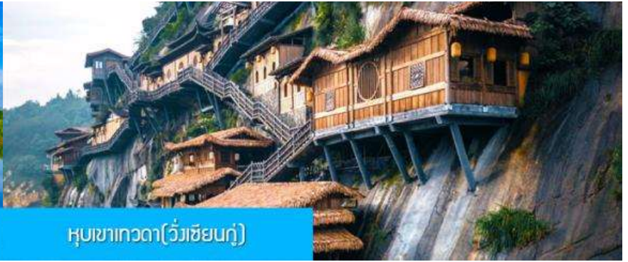
หุบเขาเทวดา(วังเซียนกุ)