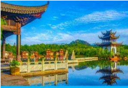
หมู่บ้านโบราณ สุ่มั่วซังเหอ