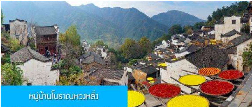
หมู่บ้านโบราณหวงหลิ่ง