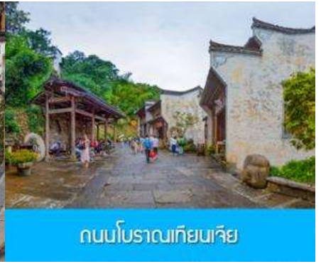
ถนนโบราณเทียนเจีย