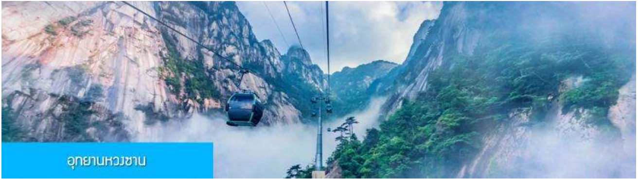
อุทยานหวงชาน

วันที่ห้า เมืองหวงชาน –พักผ่อนตามอัชยาศัยในโรงแรม หรือท่านสามารถซื้อโปรแกรมทัวร์เสริมเที่ยวเขาหวงชาน – พิพิธภัณฑ์อาหารพื้นเมือง