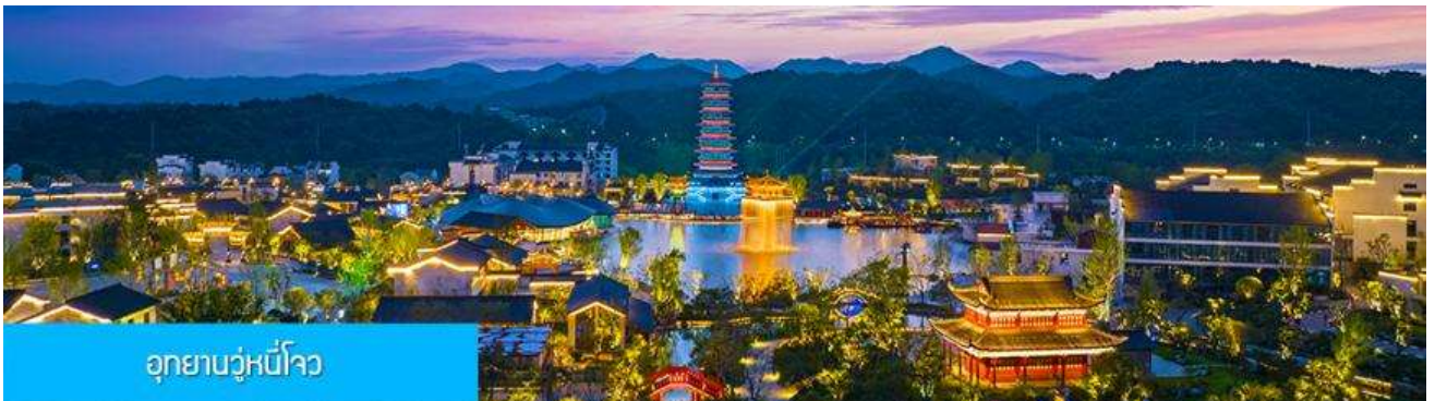
อุทยานวูหนี่โจว