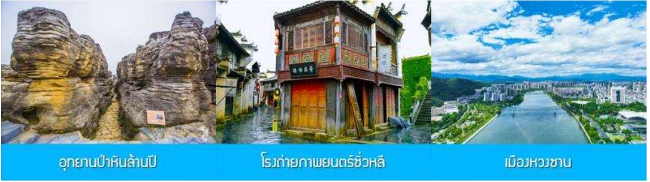
อุทยานป่าหินล้านปี