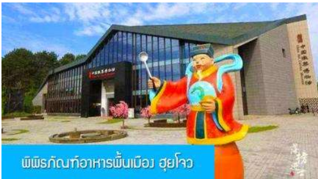
พิพิธภัณฑ์อาหารพื้นเมือง สุยโจว

เที่ยง อาหารเช้ามื้อกลางวัน ( ท่านสามารถเลือกชิมอาหารพื้นเมืองในระแวกโรงแรมได้ตามอัชยาศัย )