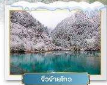
จิวจ้ายโก