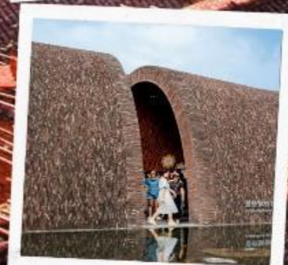
จิ่งเต๋อเจิ้น