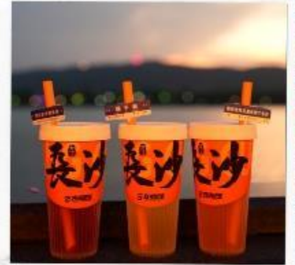
เซียงเจียงริเวอร์ไซด์