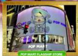
POP MART FLAGSHIP STORE