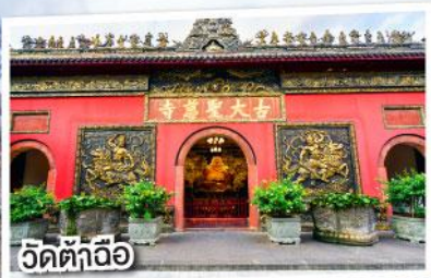
วัดต้าฉื่อ