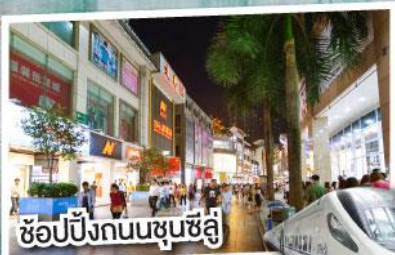
ช้อปปิ้งถนนชุนซีลู่