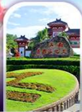
อุทยานหนานชาน