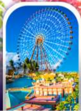
เมืองเฟินตาศี