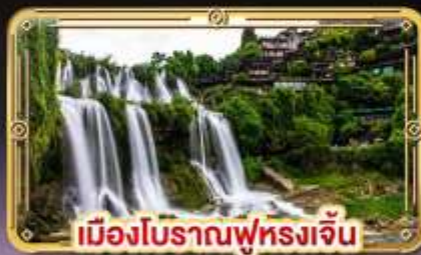
เมืองโบราณฟุหลงเจิ่น