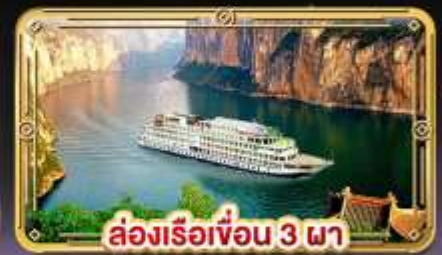
ล่องเรือเขื่อน 3 ภา