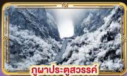
กวนาประตูสวรรค์