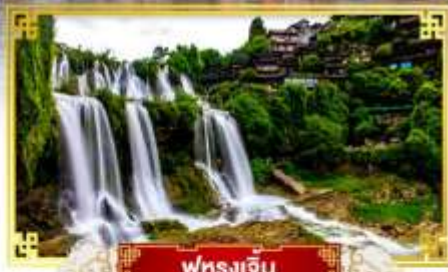
ฟุรงเจิน