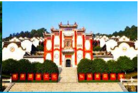
บ้านเกิดกวี ขวี่หยวน

วันที่สอง ล่องเรือแม่น้ำแยงซีเกียง-เขื่อนลิฟท์น้ำ-สวนถ้ำสามสหาย-บ้านเกิดกวี ขวี่หยวน-เมืองเทพริดา