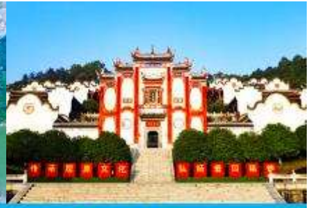
บ้านเกิดกวี ขิวหยวน