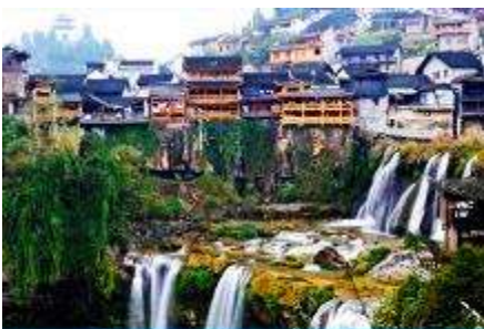
เมืองโบราณฟงหวง

https://www.cielchine.com/zhangjiajie-hotels/zui-xiang-xi-hotel/