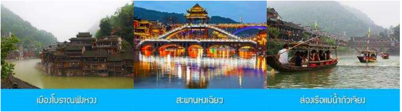
เมืองโบราณฝิงหวง