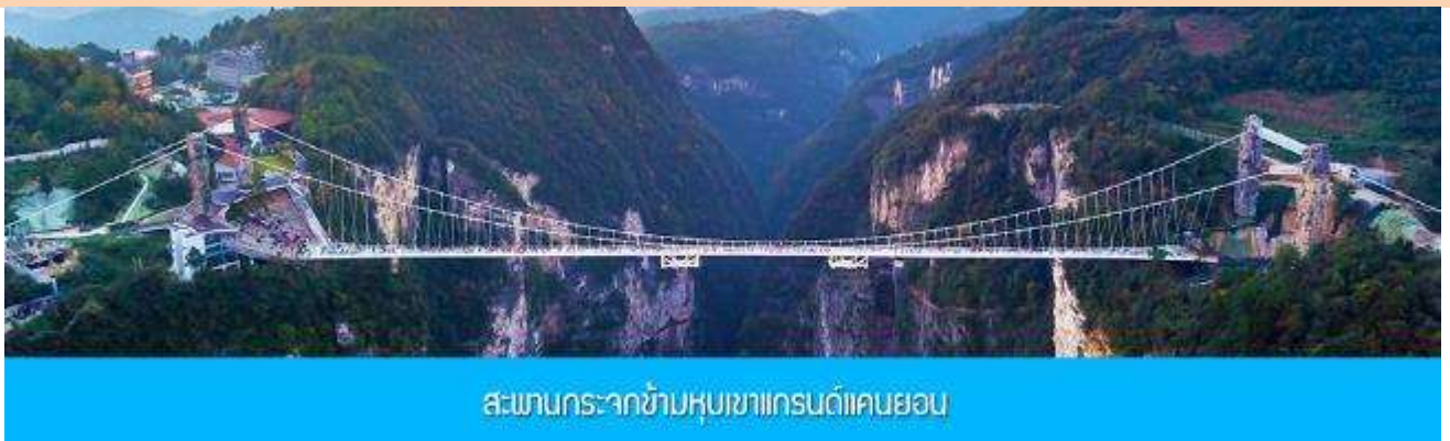
สะพานกระจกข้ามหุบเขาแกรนด์แคนยอน

หมายเหตุ การเลือกซื้อออฟชั่น ทางบริษัทขอสงวนสิทธิ์หากจำนวนผู้ซื้อไม่ถึง 15 ท่าน, ออฟชั่นนั้นไม่สามารถจัดให้ลูกค้าไปเที่ยวได้ จึงเรียนมาเพื่อให้ลูกค้าได้เข้าใจถูกต้องตรงกัน