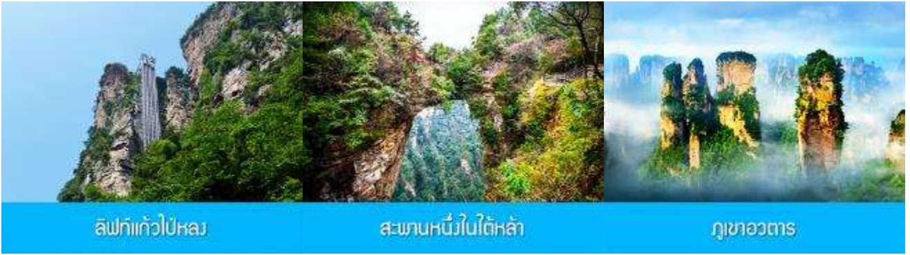
ลิฟท์แก้วไปหลง