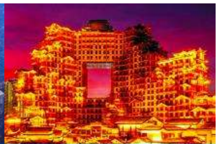
ตึกมหิศวรรษย์ 72 ชั้น