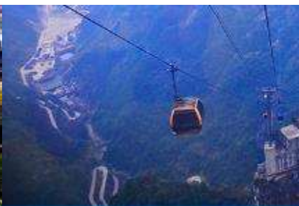
กระเช้าขึ้นเทียนเหมินซาง