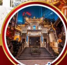
วัดหลัวอัน