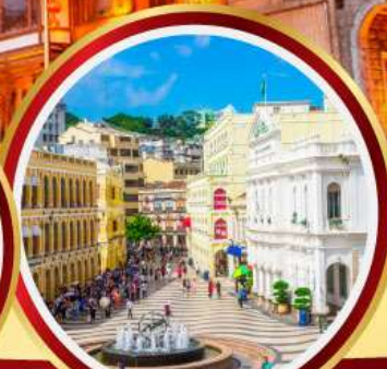
เซนาโดสแควร์