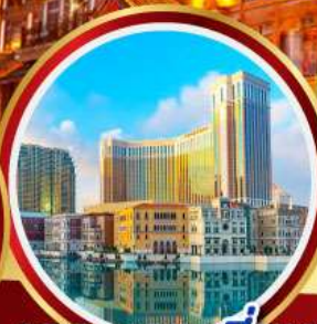
เดอะเวเนเชียน