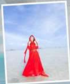
ทะเลสาบเกลือตาซา