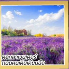
ดอกลาเวนเดอร์ ถนนคนเดินเตียนฉือ