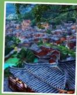
หมู่บ้านแม้วซีเจียง