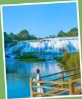
น้ำตกโต้วพั่วถาง