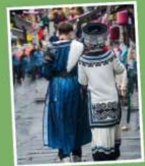
เมืองโบราณชิงเหยียน