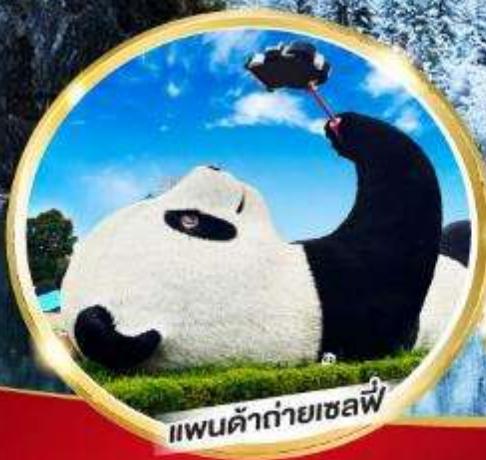
แพนด้ายักษ์เซลฟี่