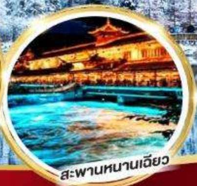
สะพานหนานเฉียว