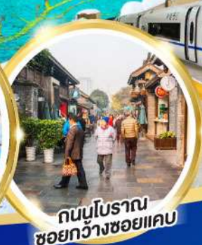
ถนนโบราณ ซอยกว้างซอยแคบ