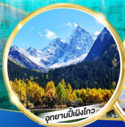
อุทยานปีฉิ่งโก