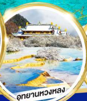
อุทยานหลวงหลง