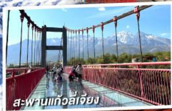
สะพานแก้วลี่เจียง