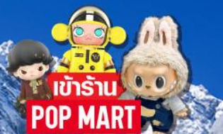
เข้าร้าน POP MART