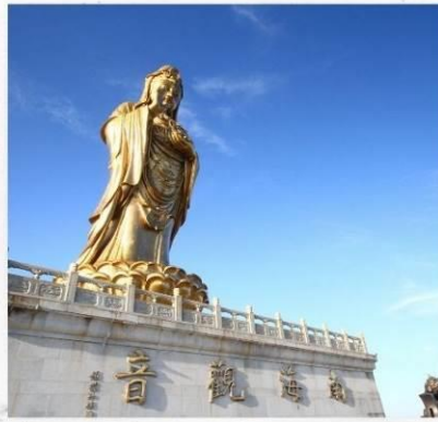
เกาะผู้ไถวซาน