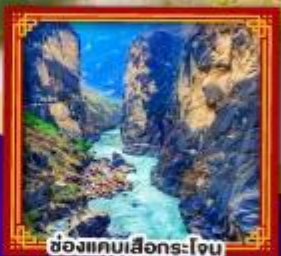
ช่องแคบเสื่อกร-โจ