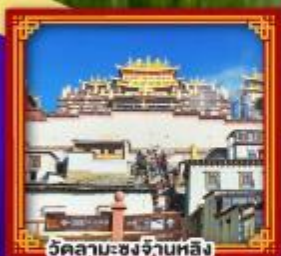
วัดลามะซงจ่านหลิง