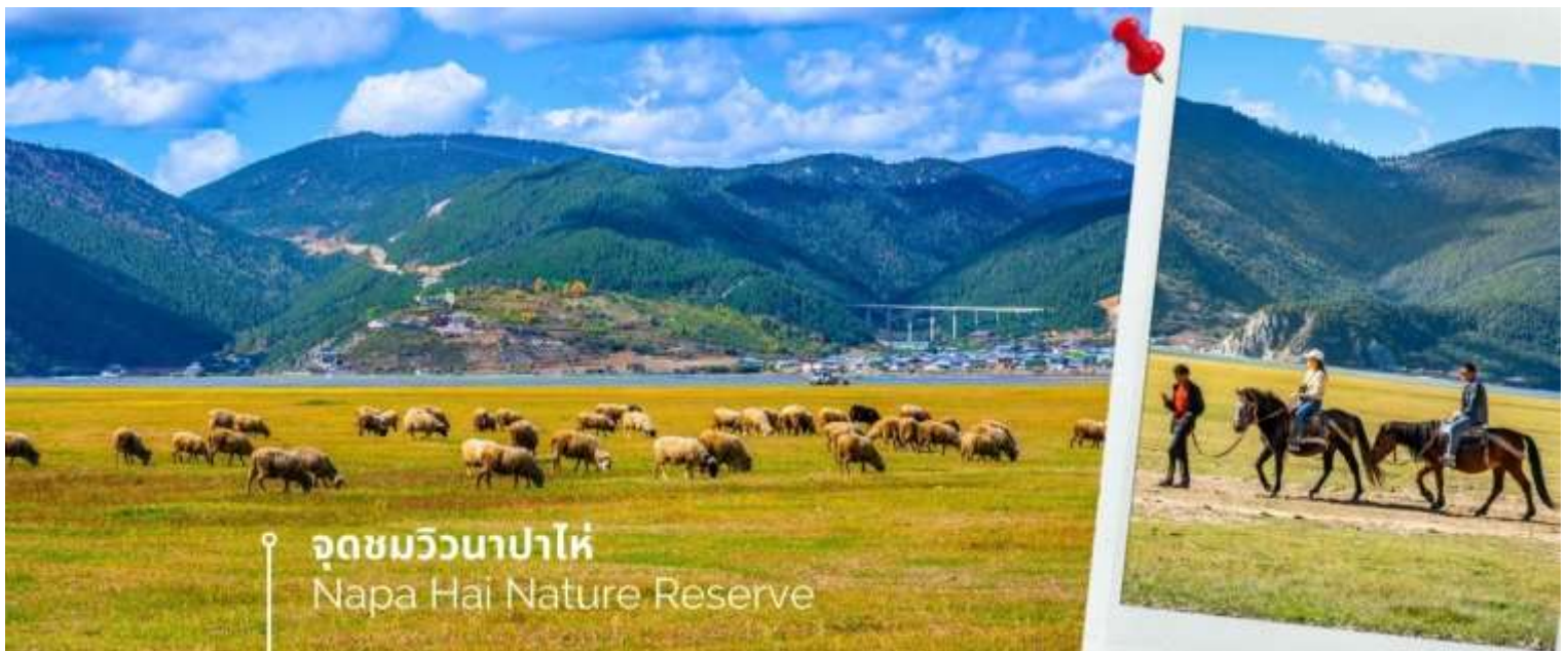
จุดชมวิวนาปาไห่ Napa Hai Nature Reserve

จากนั้นเดินทางไปยัง จุดชมวิวนาปาไห่ พื้นที่ราบสูง ที่สูงขึ้นไปมากถึง 3,266 เมตรจากระดับน้ำทะเล ครอบคลุมพื้นที่ 660 กิโลเมตร ห้อมล้อมไปด้วยเทือกเขาทั้ง 3 ด้านและมีลำธาร 2 สายไหลมารวมกัน ความอลังการของวิวทิวทัศน์ที่ทำให้คนต่างก็อยากขึ้นไปชื่นชมที่สูงขนาดนั้น ก็เพราะความสวยงามที่เปลี่ยนไปตามแต่ฤดูกาล สวยงามทั้งปี จะเป็นช่วงที่ทุ่งหญ้าเขียวขจีและดอกไม้ขึ้นบานสะพรั่ง ช่วงฤดูหนาวเทือกเขาและทะเลสาบชาวโพลน บรรยากาศฤดูร้อนจะสดใส ท้องฟ้ากระจ่าง และจะพบเหล่าฝูงม้า แกะและจามรีที่ลงมาทะเลสาบที่เป็นแหล่งน้ำและอาหาร