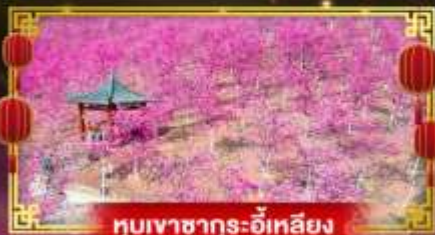
หุบเขาซาคุระอิ๋นเหลียง