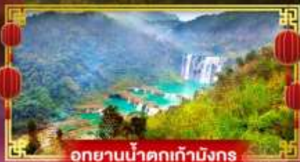
อุทยานน้ำตกเก้ามังกร