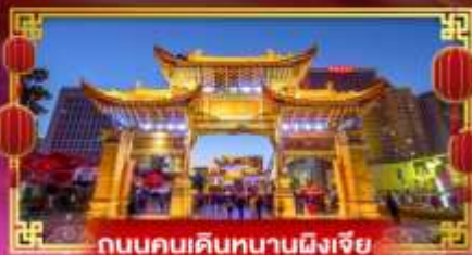
ถนนคนเดินหนานผิงเจีย

ชมทุ่งดอกมิสเตอร์ดไหลอึ้ง “เทศกาลชมดอกซากุระบานหุบเขาอิ๋นเหลียง”