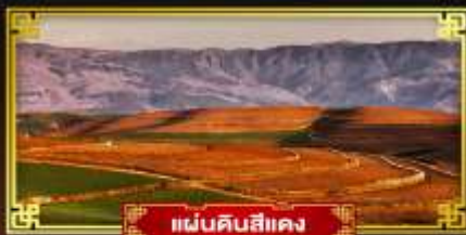
แผ่นดินสีแดง