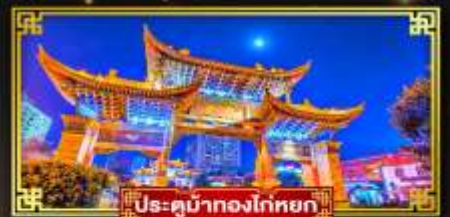
ประตูม้าทองโก่หยก