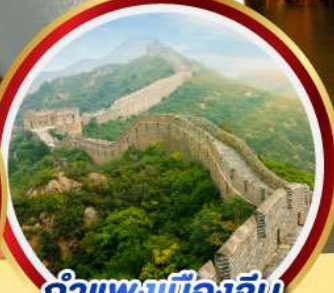
กำแพงเมืองจีน ด่านจวิ้งกวน