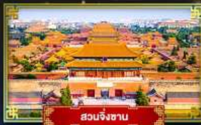
สวนจิงซาน