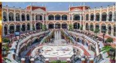
Florentia Village Outlet

*ทางบริษัทฯ ขอสงวนสิทธิ์ในการสลับโปรแกรมทัวร์ตามความเหมาะสมขึ้นอยู่กับสถานการณ์ปัจจุบัน โดยทำผิดซึ่งผลประโยชน์ของลูกค้าเป็นสำคัญ