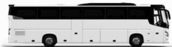
ตัวอย่างรถทัวร์ 1 คัน

ค่าที่พักตามที่ระบุในรายการหรือเทียบเท่าระดับเดียวกัน (ห้องพักละ 2 ท่าน) หากประเภทห้องพักท่านริเวรสนาเดิม อาทิ เช่น ริเวรสห้องพักเป็น TWIN BED หรือ DOUBLE BED ทางบริษัทขอสงวนสิทธิ์ในการปรับประเภทห้องพัก เป็นตามที่โรงแรมมีอยู่ โดยไม่ต้องแจ้งให้ทราบล่วงหน้า