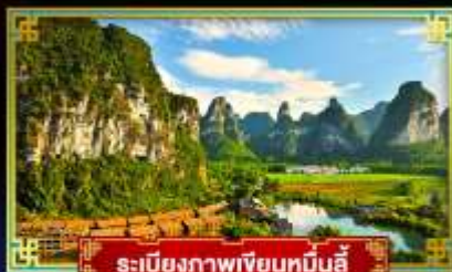
ระเบียบภาพเขียนหมินลี่