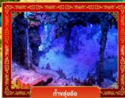
ถ้ำสุ่ยอ้อ