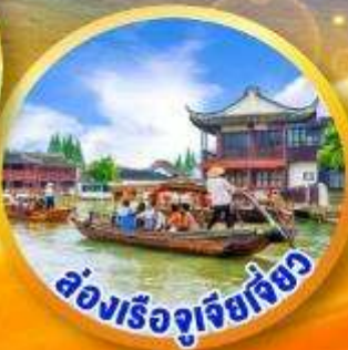
ล่องเรือจูเจียเจียว