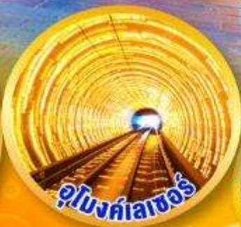
อุโมงค์ลาเซอร์