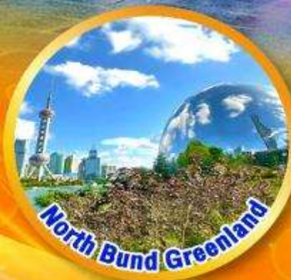
North Bund Greenland