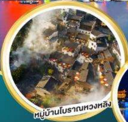
หมู่บ้านโบราณทองหลิง