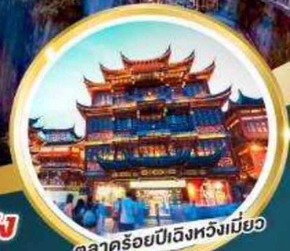
ตลาดร้อยปีเฉิงหวงเหมี่ยว