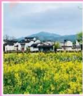
หมู่บ้านโบราณเฉิงชาน