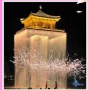
อันวูโจว