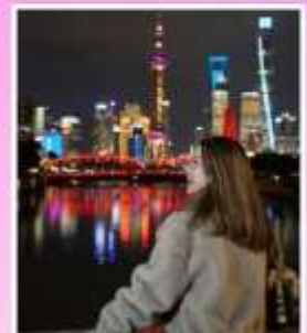
สะพานจ๋าฟู่ตู้เซี่ยอ