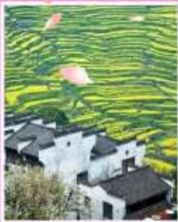
หมู่บ้านโบราณหวงหลิ่ง