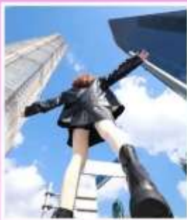
3 ตึกใหญ่ แห่งเมือง เซี่ยงไฮ้