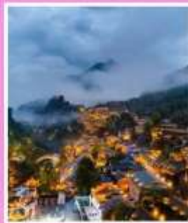
หุบเขาเทวดาวังเซี่ยนทู่