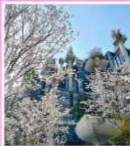
TIAN AN 1,000 TREES SQUARE