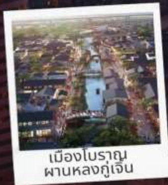
เมืองโบราณ ผานหลงกุเจิน