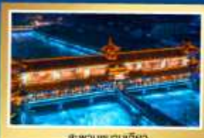
สปาบนเท้านเจียว