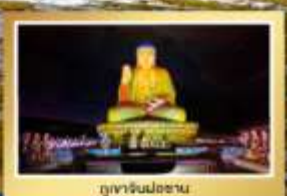
ภูเขาจินฝอซาน