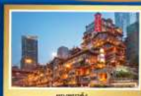
ตองชยาตั้ง