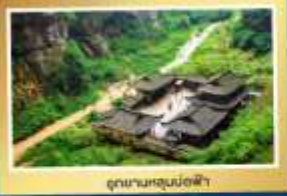
อุทยานนกยูงม่อฟ้า