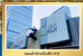
พณฯจีนเป็นมิตร 4R