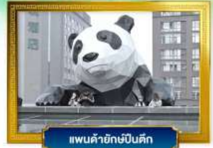
แพนด้ายักษ์ปิ่นตึก