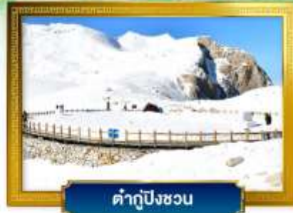
คำตู้ปังชว่น

ช้อปปิ้งจุดถนนคนเดินชุนซีลู่, ถนนไท่กู่หลี่