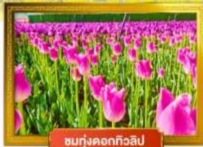
ชมทุ่งดอกทิวลิป