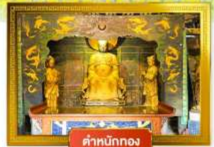
ตำหนักทอง