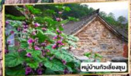
หมู่บ้านทิวเสียงซุน