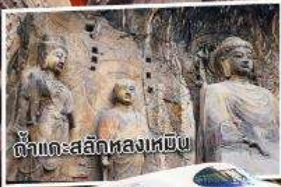
ค้ำคะสลักหลงเหมิน