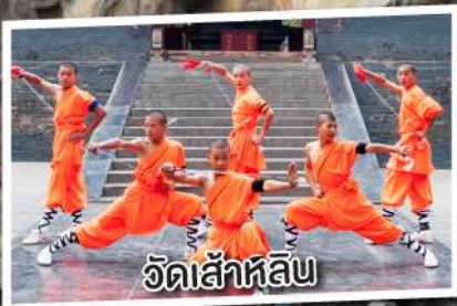
วัดเส้าหลิน