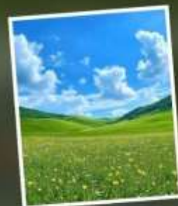
ทุ่งหญ้าแห่งท้องฟ้า