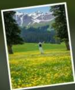
ทุ่งหญ้านาราตี

รับฟรี!! AIG ประกันสุขภาพ และ อุบัติเหตุ 2 ล้านบาท