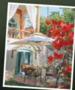
หมู่บ้านคางจันฉี