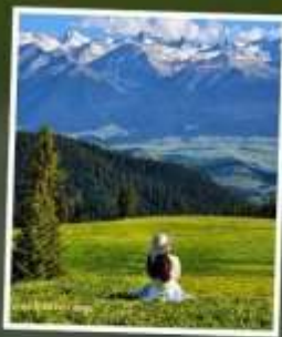
ทุ่งหญ้านาคาลาจัน