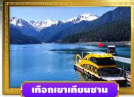
เทือกเขาเทียนชาน