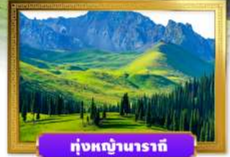
หุบภูเขานาราตี