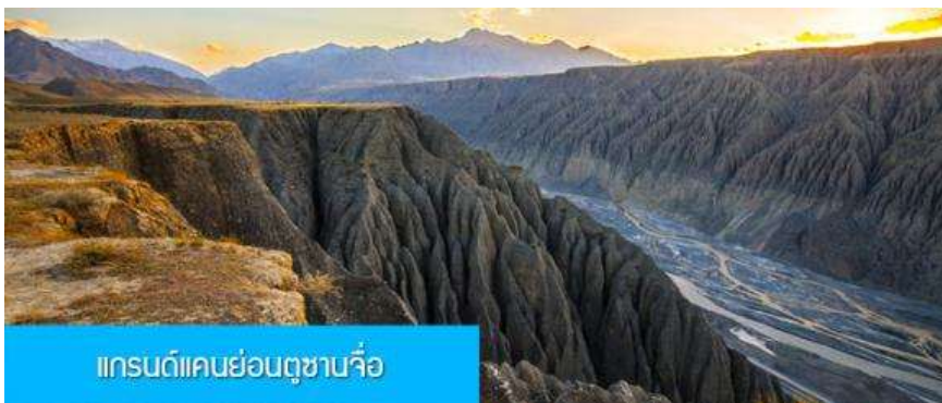
แกรนด์แคนยอนตูซันจื่อ

พักที่ RUI JING HOTEL โรงแรมระดับ 4 ดาวท้องถิ่นหรือเทียบเท่าในเมืองชุยจุน