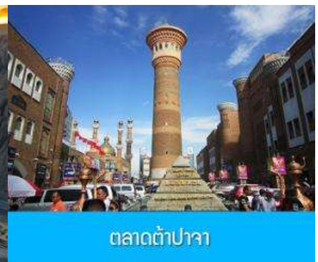
ตลาดต้าปาจา