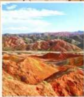
ภูเขาสายรุ้งต้นเซีย