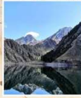
ทะเลสาบเทียนฉือ