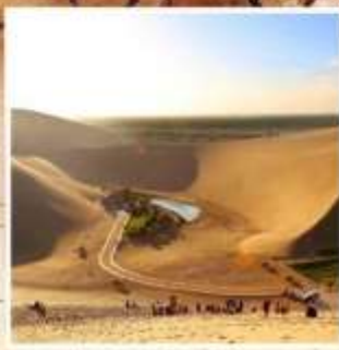
สระน้ำวงพระจันทร์