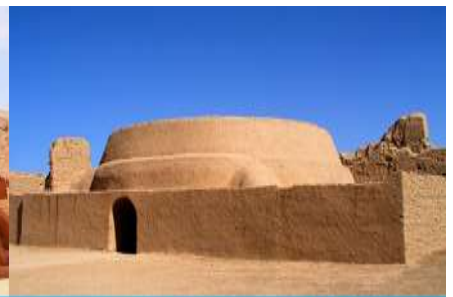
เมืองโบราณเกาซางกู๋เจิง

วันที่หก ชมระบบชลประทานกู๋หลู่ฟาน – กำปั้นระพันองค์- เมืองโบราณเกาซางกู๋เจิง –เดินทางสู่เมืองอูรูมูฉี